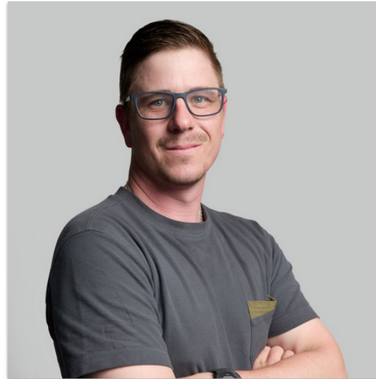
Stv. Head Greenkeeper