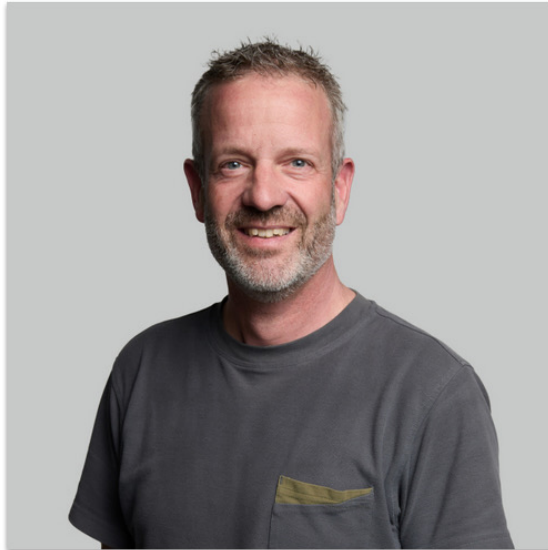
Head Greenkeeper burren@golfclub.ch