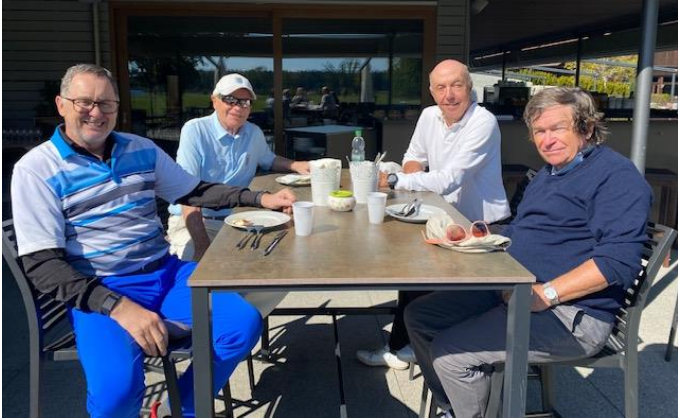
Bei Loch 9 erwartete uns ein reichhaltiges Buffet

Bei ausgezeichnetem Golfherbstwetter, wunderbar warm und wolkenlos, fand zum 1. Mal ein Herbstturnier statt. Es ist vorgesehen, dass dieser Anlass zu einem fixen Punkt im Seniorenkalender wird. Start war ab Platz BLAU. Die Spielart war „Four Balls better Ball“ – 2er Shamble. Schade, dass nicht mehr Senioren (nur 40 spielten mit) an einem solchen Turnier bei diesem super Wetter mitmachten.